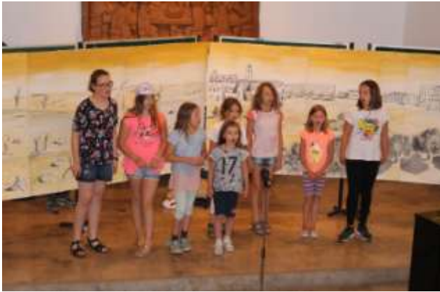
Ein Reisender bricht auf von Jerusalem nach Jericho...