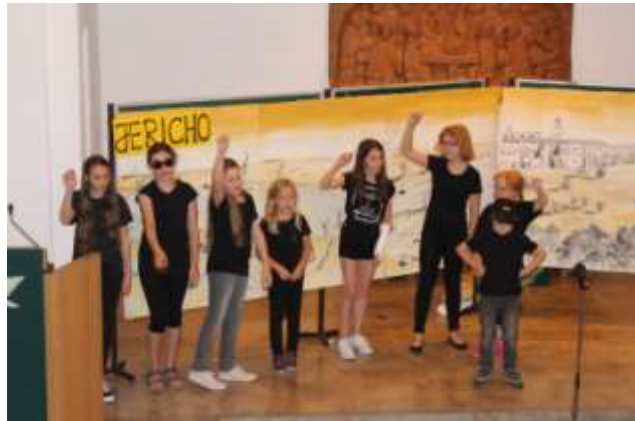
...eine Räuberband auf der Suche nach Beute....