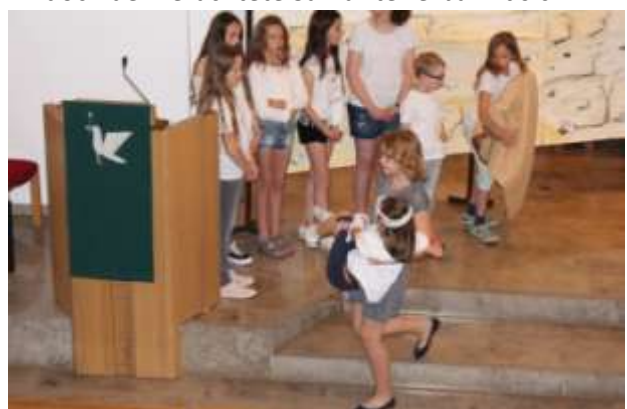
...und bringt den Verletzten in eine Herberge...