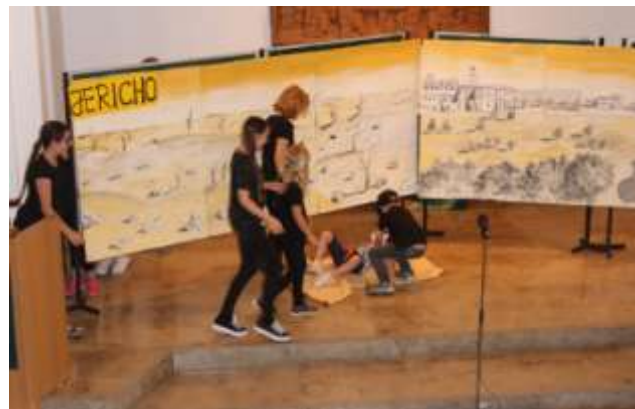
.... der Reisende wird überfallen...