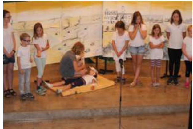
...doch der verachtete Samariter erbarmt sich ...