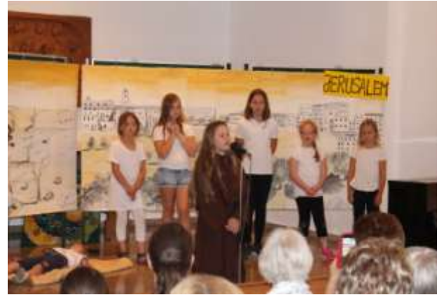
... keine Zeit zu Helfen ...